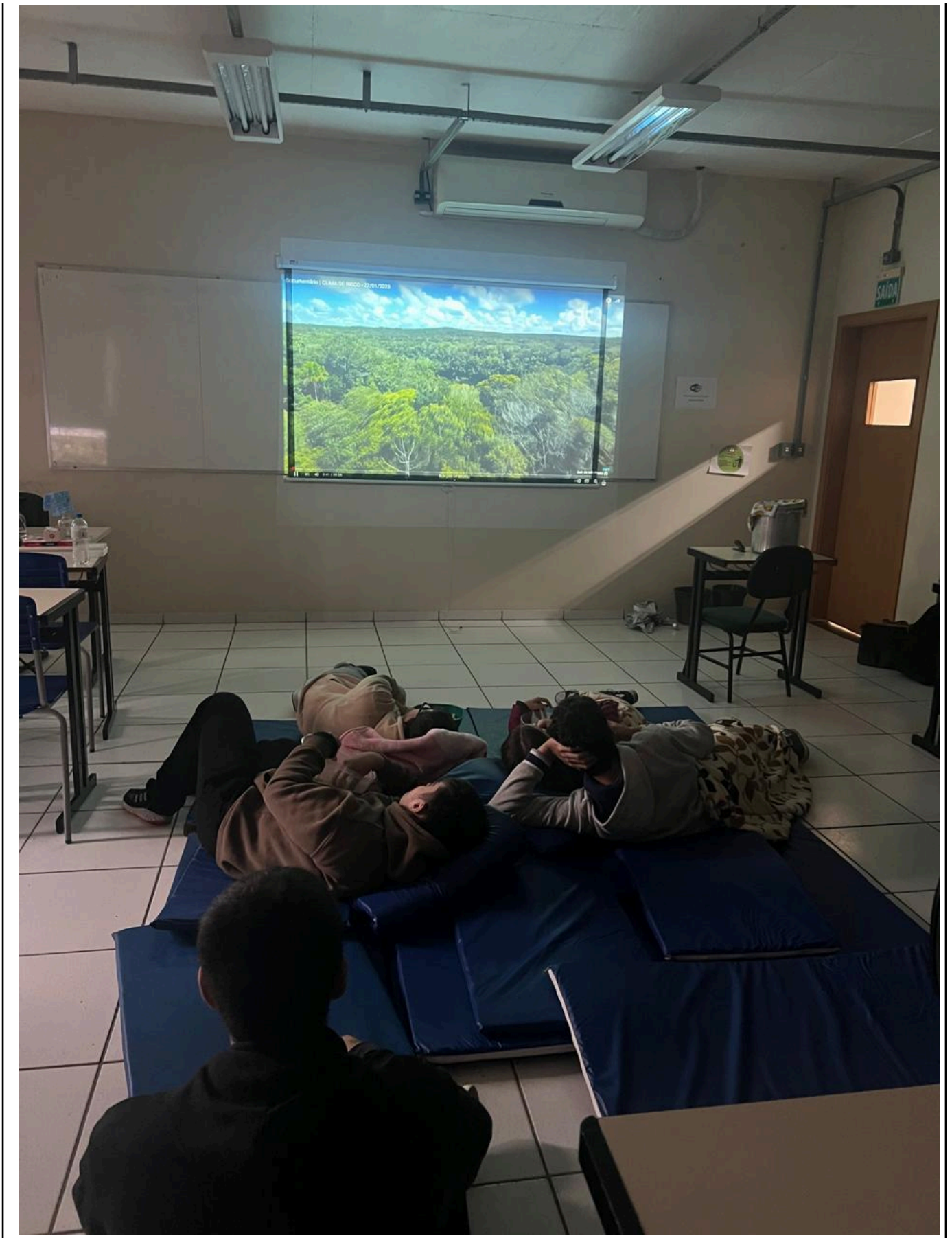
3.7. Tema/ Título da Atividade: Participação no I Mês do Meio Ambiente do IFSul - plantio de mudas de araucária