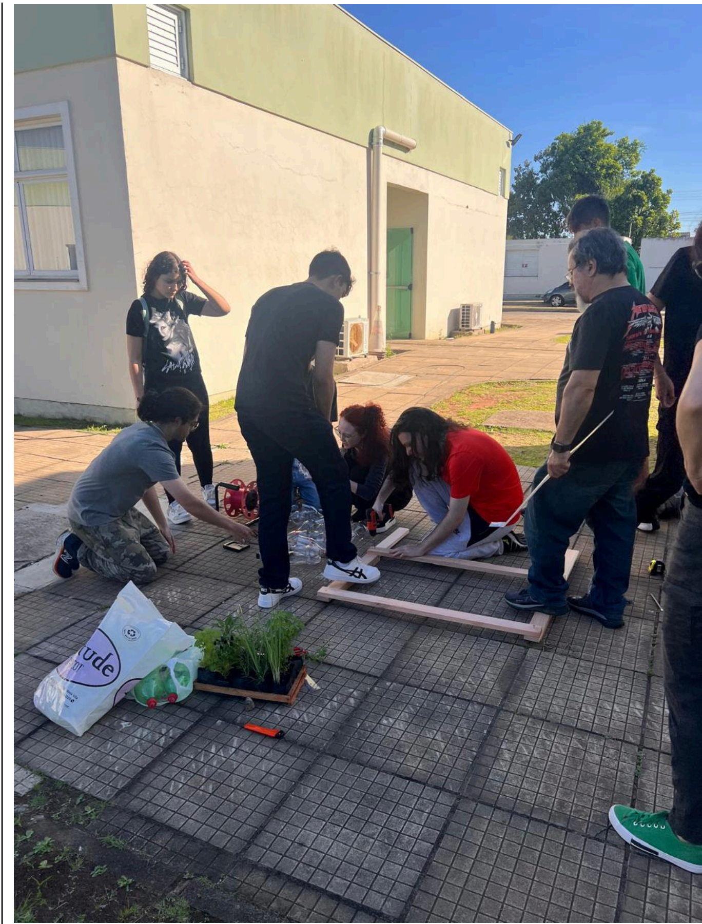
3.10. Tema/ Título da Atividade: Plantio de mudas no pátio do Ifsul Campus Gravataí